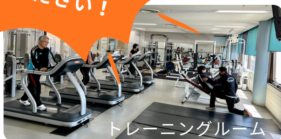
トレーニングルーム